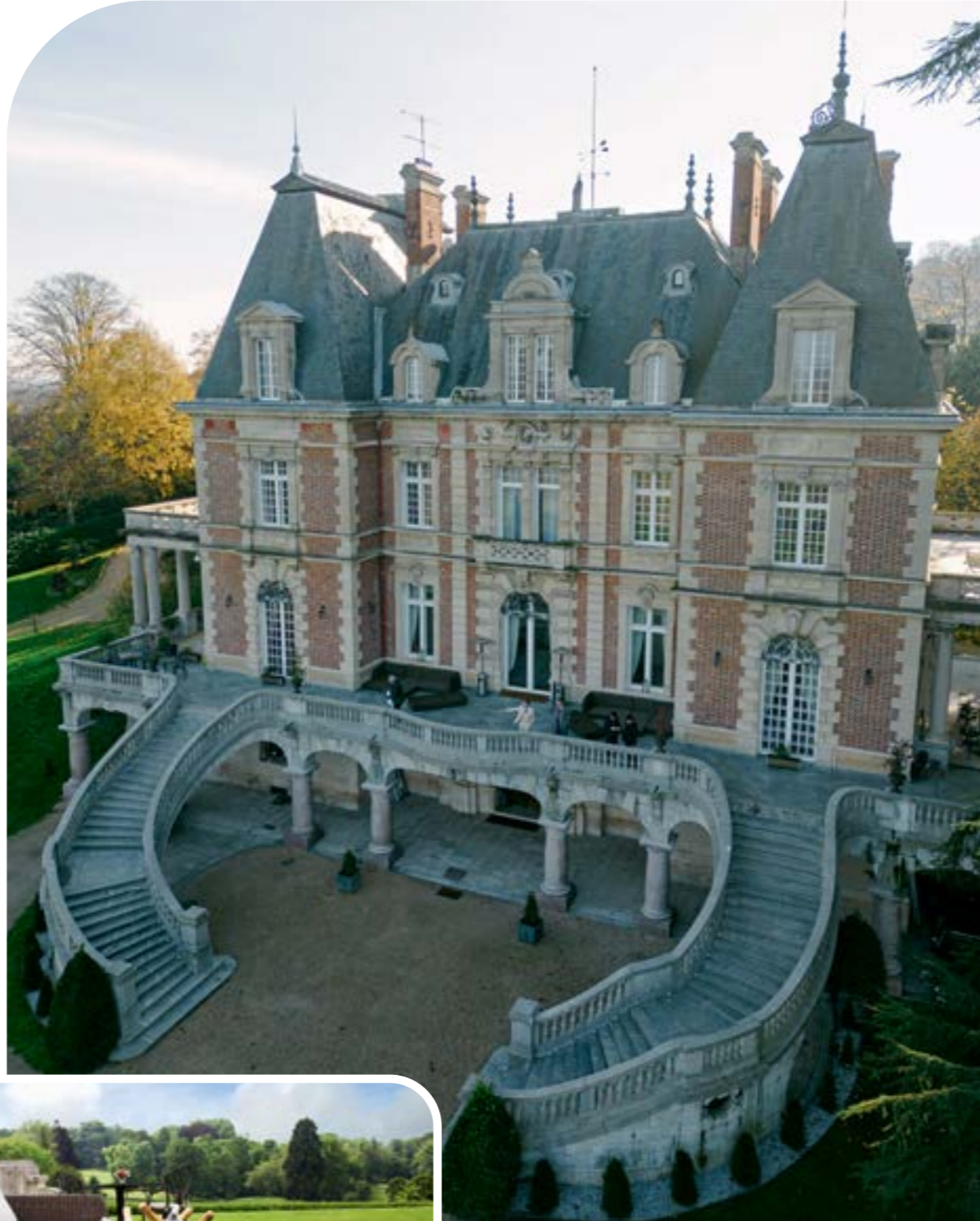
Château Bouffémont, özel işbirlikleri ile misafirlerini lüks araçlarla Paris ve etrafında organize edilen yarışmalara ulaştırıyor, VIP salon ve localara grup bileti satın alma imkanı sağlıyor.